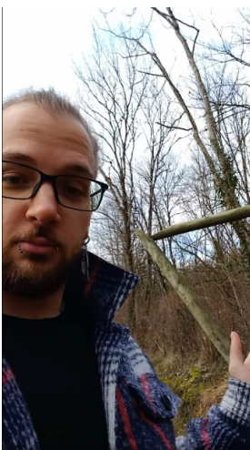
Le coup du poteau-pété

Quand le planning nous en laisse la possibilité ou qu'on tombe sur une occasion vraiment spéciale, on fait quelques vidéos. On vous en a choisi 3 pour ce bilan mais vous pouvez bien entendu en retrouver plus sur les divers réseaux !