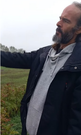
Dans le département voisin, c'est pas mieux

https://www.facebook.com/scani89/videos/1282326859622760/