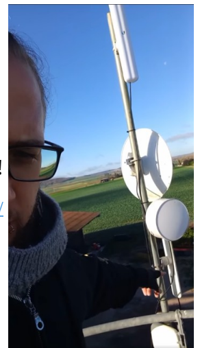
Une antenne cramée, ça arrive !

https://www.facebook.com/scani89/videos/614608847754490/